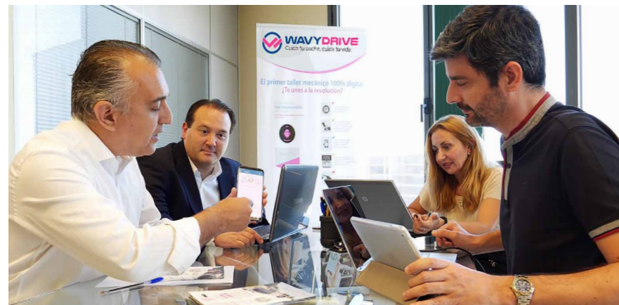
Miembros del equipo de WavyDrive explican el funcionamiento de su aplicación.

Entre los proyectos empresariales seleccionados por la incubadora High Tech Auto se encuentra WavyDrive, concebida como una aplicación con funcionalidades básicas y otras más singulares como puede ser el caso de la conducción silenciosa (para que nadie nos moleste cuando estamos al volante). A través de WavyDrive, también es posible pedir presupuestos a talleres cercanos cuando necesitemos ayuda mecánica o acceder a gamas de precios para cambiar las ruedas o el aceite de nuestro vehículo.